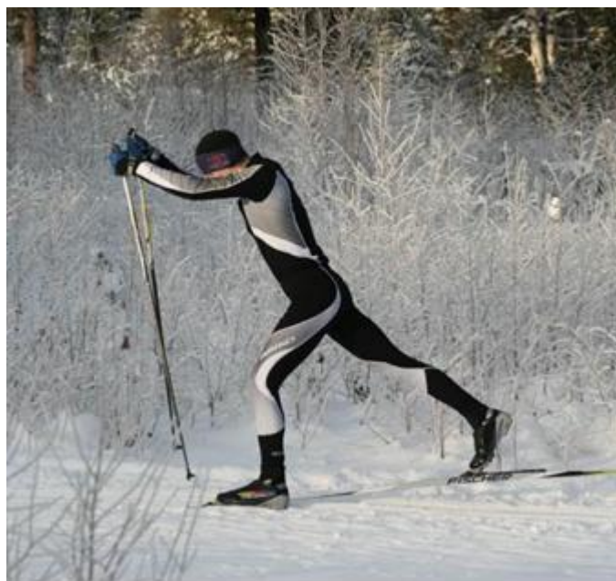
Рис.10. Одновременный одношажный ход

Цикл одновременного одношажного хода состоит из одного скользящего шага, одновременного толчка палками и проката на двух лыжах (рис.10).