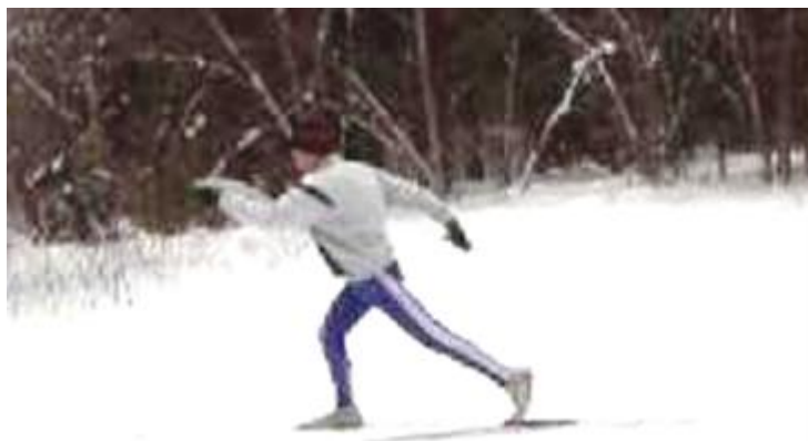
Рис.8. Скользящий шаг на лыжах без палок

Более подготовленным занимающимся изучение работы ног можно начинать сразу с выполнения скользящего шага (рис.8).