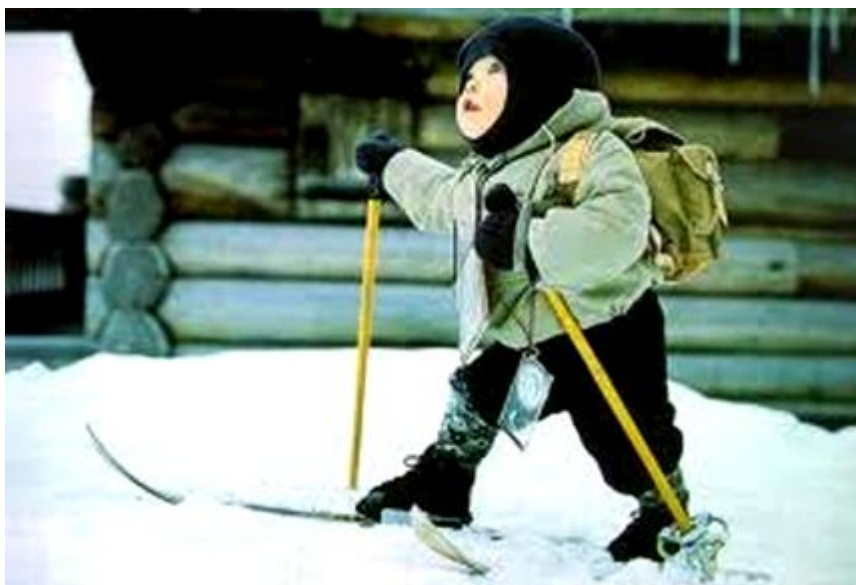
Рис.2. Подъем «полуелочкой»

Подъем «полуелочкой» (рис.2) применяется на подъеме наискось или когда лыжи проскальзывают назад. При подъеме наискось по склону так же, как попеременным двухшажным ходом, лыжа, находящаяся выше по склону, ставится прямо в направлении движения, а другая лыжа – на внутреннее ребро с разворотом носка в сторону. Туловище следует наклонять вперед в зависимости от крутизны склона. Отталкивание палками производить, как при подъеме попеременным двухшажным ходом.