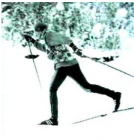
Рис.7. Попеременный двухшажный ход

Основой правильной техники этого хода является почти одновременное отталкивание левой (правой) ногой и правой (левой) палкой с последующим скольжением на одной лыже (рис.7)