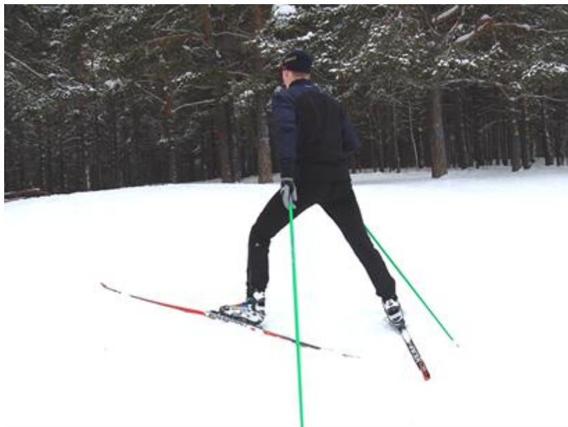
Рис.3. Подъем «елочкой»

Подъем «елочкой» (рис.3) применяется на склонах средней крутизны. При подъеме носки лыж разводятся в стороны и лыжи ставятся на внутренние ребра. Палки для опоры и отталкивания ставятся сзади. Чем круче подъем, тем шире разворачиваются носки лыж.