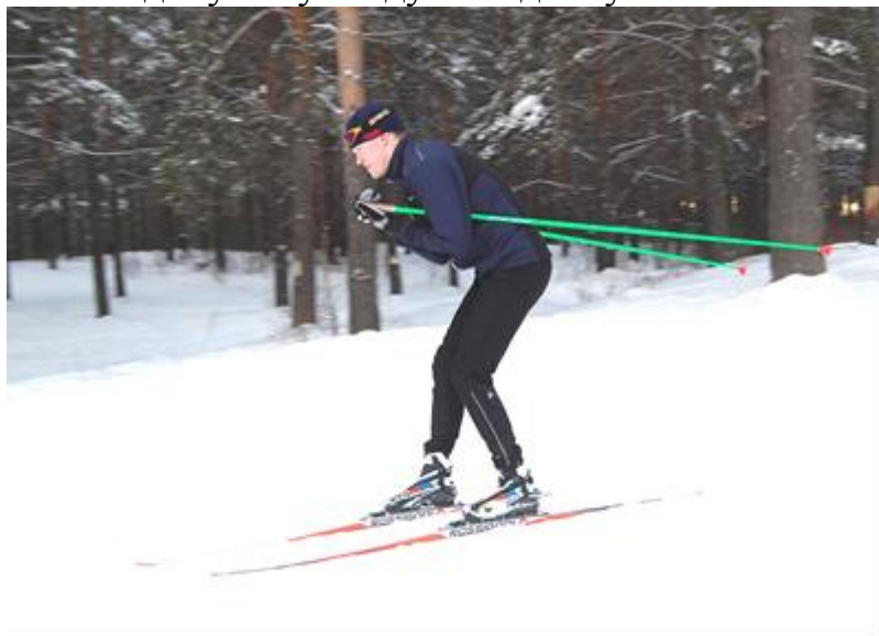
Рис.4.Средняя или основная стойка при спуске на лыжах

На незнакомых склонах, на склонах средней крутизны при наличии неровностей и в случае, если во время спуска необходимо выполнить повороты или торможения, применяется средняя или основная стойка (рис.4). При спуске в средней стойке лыжи поставить на ширину ступни, полуприсесть, корпус слегка наклонить вперед, руки согнутые в локтях, вынести вперед, палки держать кольцами (лапками) назад. Для сохранения устойчивости дону ногу следует выдвинуть несколько вперед.