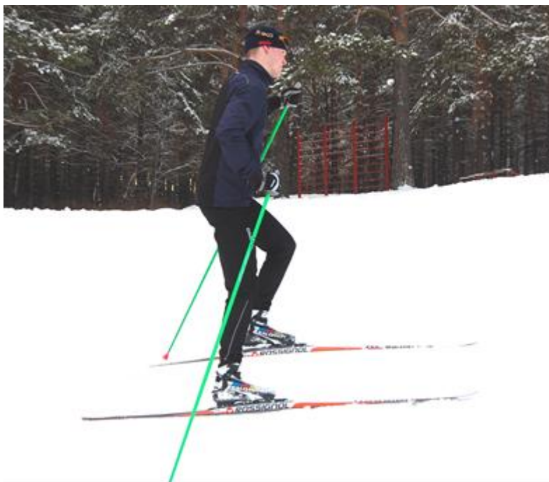
Рис.1. Подъем «лесенкой»

можно выполнять на два счета. На счет «Раз» переставить верхнюю лыжу и палку, на счет «Два» - нижнюю лыжу и палку.