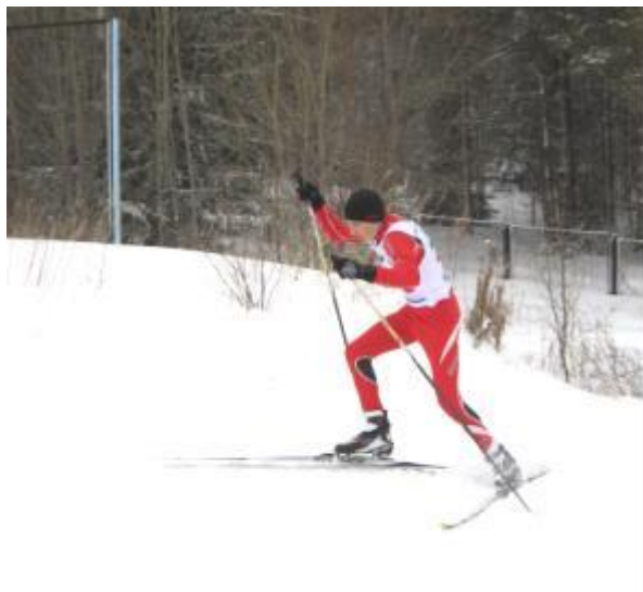
Рис.12. Одновременный двухшажный коньковый ход

счет «раз» - отталкивание руками, отталкивание правой ногой и плавный перенос тела на левую лыжу, руки сзади (рис.12).