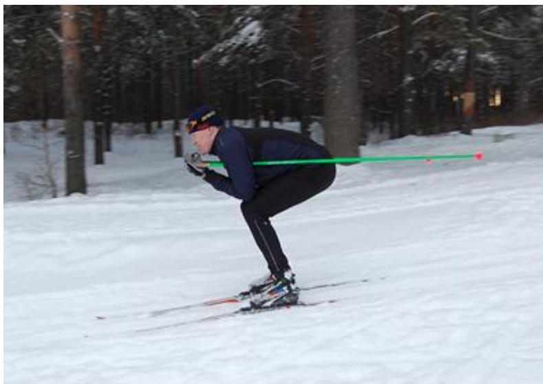
Рис.6. Стойка «отдыха»

Стойка «отдыха» (рис.6) применяется на пологих и длинных склонах. Для принятия стойки «отдыха» следует в средней стойке положить руки предплечьями на бедра, палки держать под мышками.