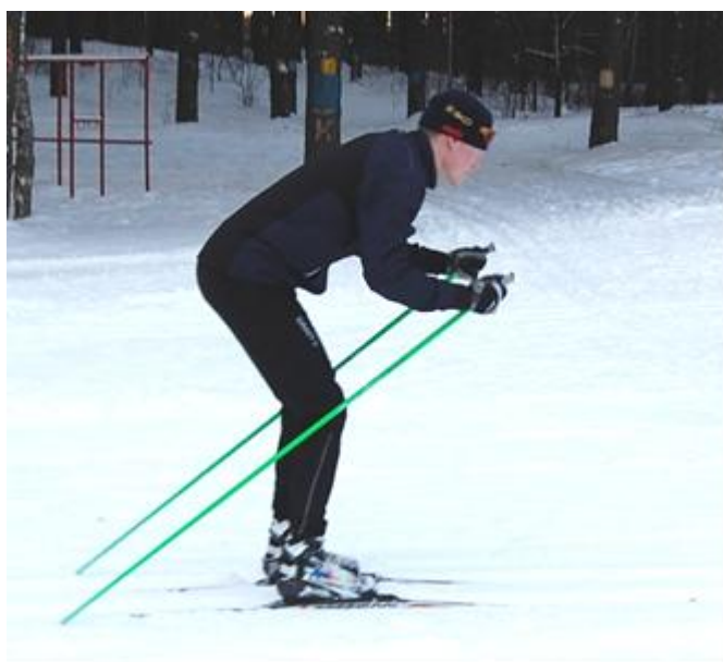
Рис.9. Одновременный бесшажный ход

Передвижение этим ходом осуществляется только за счет отталкивания одновременно двумя палками и наклона туловища для усиления отталкивания (рис.9).